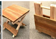
折り畳み式ミニチェア