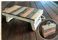
折り畳み式ミニテーブル