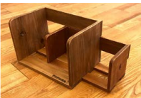
スライド式ブックスタンド