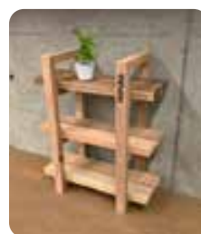
※植物は含まれません

DIYは興味あるけどちょっと不安...そんな方にぴったりなプログラムです。初回は初心者むけおしゃれな三段棚です! 地域で間伐した国産材を使用 サイズ:幅500mm高600mm奥220mm 材:スギ