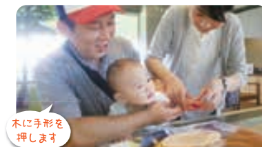
木に手形を押します

料金...1コ 600円(税込) 所要時間:30分程度 木に手形を押します。 お子様の記念にいかがですか?