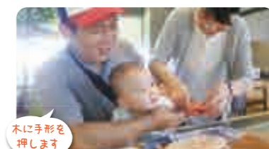
木に手形を押します

料金...1コ 600円(税込) 所要時間:30分程度 木に手形を押します。 お子様の記念にいかがですか?