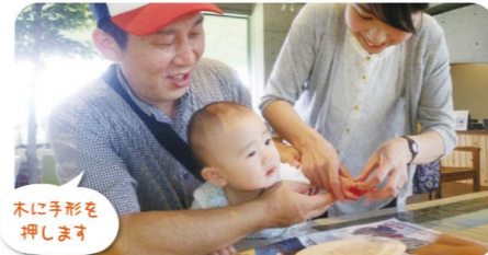
木に手形を押します 0歳からできます