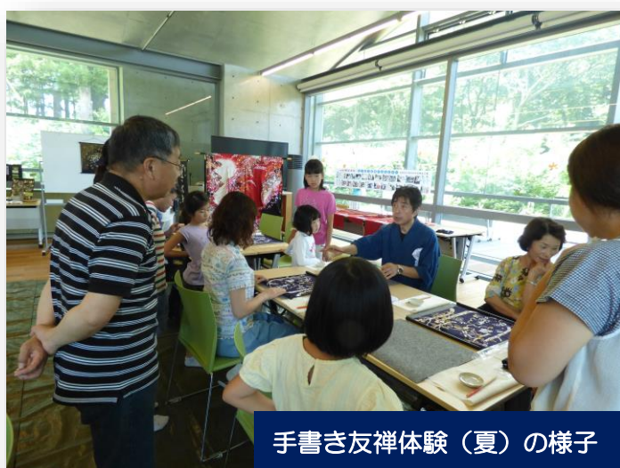
手書き友禅体験（夏）の様子

ポポラ「森のホール」実施会場では、手書き友禅体験のほかに、小物等の販売コーナーもありますので、この機会にぜひ♪ 参加しない方でも、ご見学いただけます♪